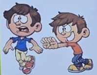
Нельзя толкать друг друга