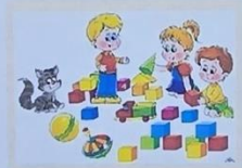
Нельзя бросаться кубиками