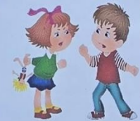
Нельзя друг у друга отнимать игрушки